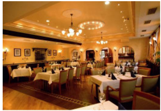
RITTERSAAL BIS ZU 100 PERSONEN