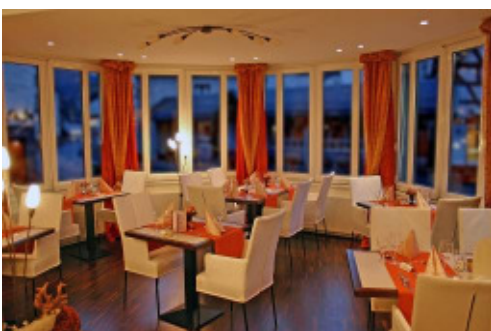
WIEDTALSTUBE – BIS ZU 20 PERSONEN