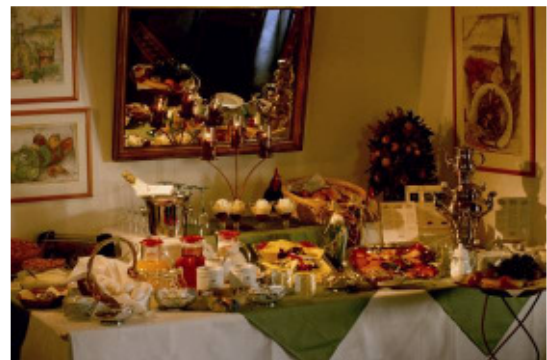
BUFFET IM RITTERSAAL