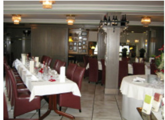
WEINSTUBE – BIS ZU 35 PERSONEN