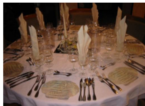
TISCH- UND DEKORATIONSBEISPIEL