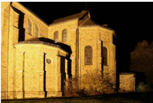
PFARRKIRCHE „MARIA HIMMELFAHRT“